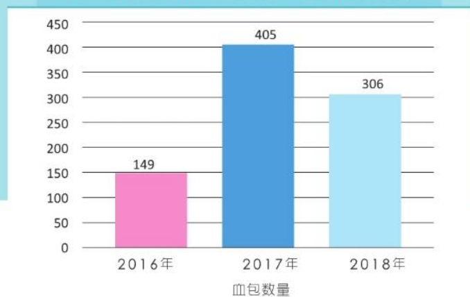
2016年至2018年 捐血运动成果报告

希望在新的一年里，我们的服务可以更臻完善和贴心，如：结束打扫工作后亲手煮午餐给老人家享用、在河流清洁活动时教育大家垃圾分类、宣扬捐血与器官捐赠的意义和社会需求等，达到事半功倍的效果。此外，也希望有更多义工的加入，让小组的服务更为多元化，像是探望癌症儿童或患者、带孤独的老人家出游等。